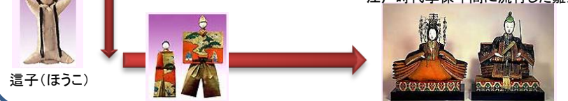
江戸時代享保年間に流行した雛人形